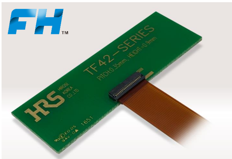
FH Flip-Lock Pioneer Hirose