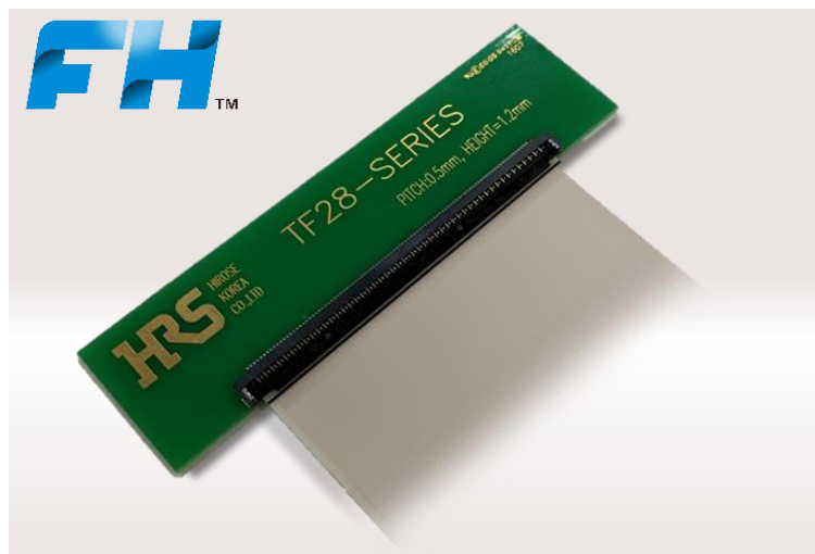
FH Flip-Lock Pioneer Hirose